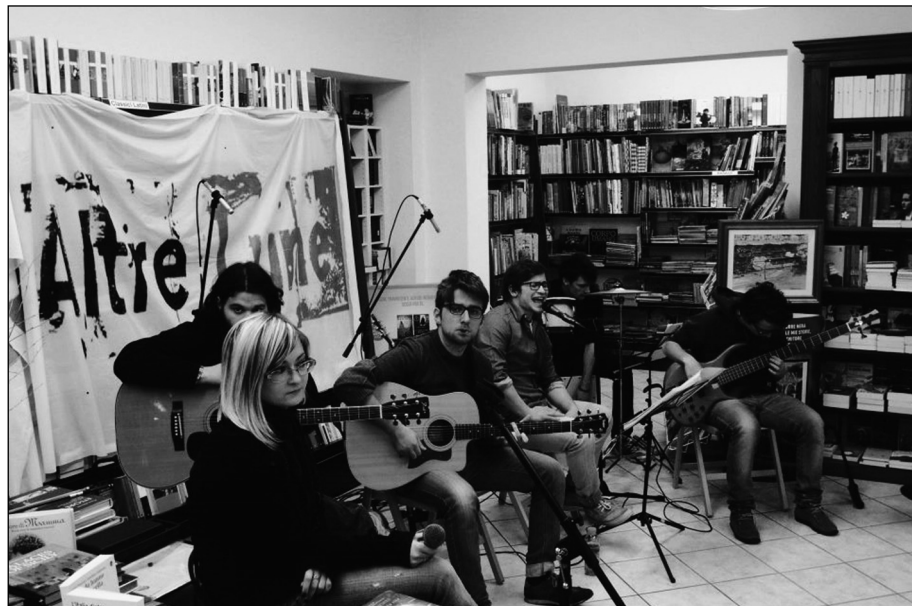
Evento "Carcere: realtà italiana" del 22 febbraio 2013 c/o la Libreria Castelli Podavini di Desenzano.